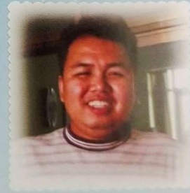
တစ်ယောက်ကြိမ်